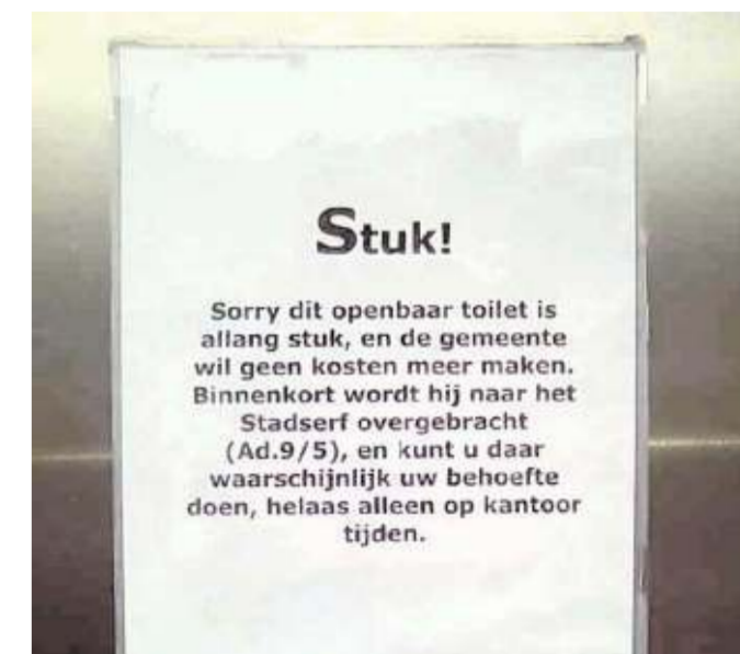
„Enige tijd terug werd met enige publiciteit een openbaar toilet in gebruik genomen in het centrum van Woerden. Helaas, zoals dat vaker gaat met dit soort voorzieningen, raakte deze defect. De aangeplakte tekst spreekt boekdelen.”

In deze rubriek staan foto's waarop sporen van de mens in de publieke ruimte zichtbaar zijn gemaakt in afbeeldingen, teksten en kunstzinnige uitingen. Stuur uw foto plus toelichting naar men-@nrc.nl .